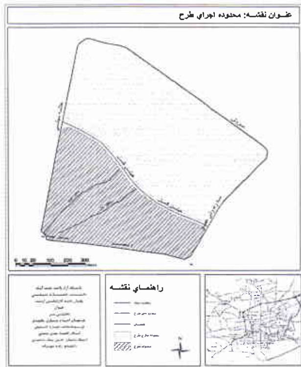
نقشه شماره (۱)